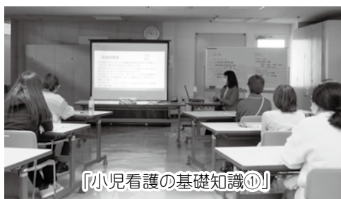
『小児看護の基礎知識①』

令和5年度は、 養成講習会を修了した 7名の方が提供会員に、 3名の方が両方会員に なりました。