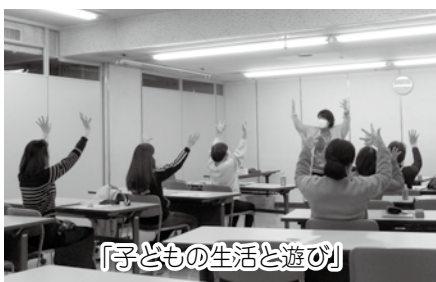
『子どもの生活と遊び』